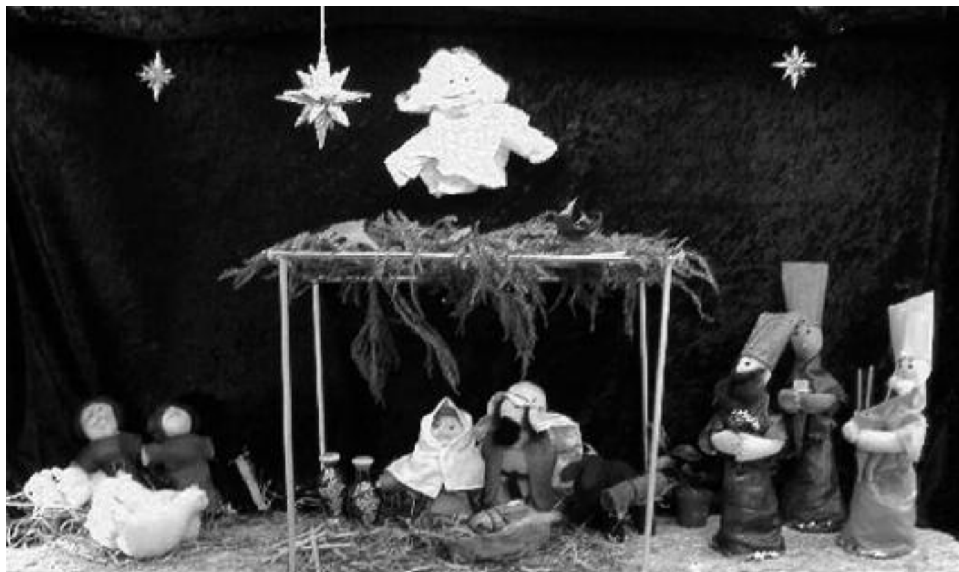
Julekrybbe.