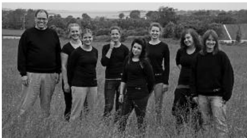
Korsangerne i »Karsten & Korallerne« er alle begyndt i Marstal Kirkekor. »Karsten & Korallerne« holder jule- og nytårskoncert i Ommel Kirke, torsdag den 30. dec. kl. 19.30.